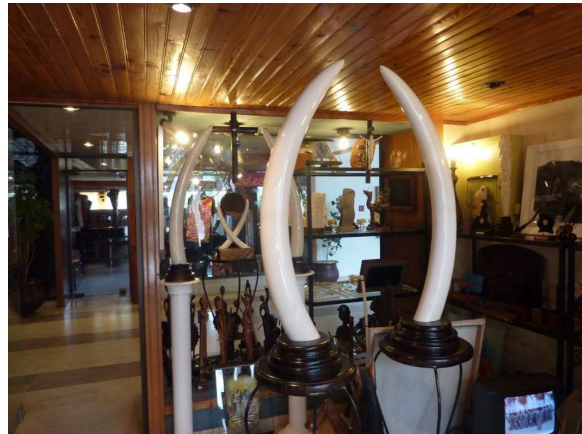
Boutique des Hotels Bénin Marina, Cotonou, 01.07.2012