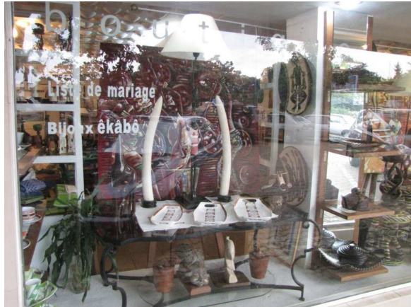
Boutique des Hôtel du Port, Cotonou, 30.06.2012