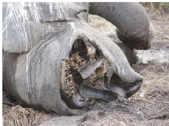
Gewilderter Elefant im Pendjari-Nationalpark, 7.4.2012

Die Initiative "Freunde des Pendjari" setzt sich mit der Website www.pendjari.jimdo.com dafür ein, Informationen über das Problem in die Öffentlichkeit zu tragen und politischen Druck auf die verantwortlichen Entscheider aufzubauen. Auf der Website verlinkt ist eine an den beninischen Präsidenten, Dr. Yayi Boni, und den deutschen Minister für wirtschaftliche Zusammenarbeit und Entwicklung, Dirk Niebel, gerichtete Petition, die bereits von mehr als 6.000 Menschen (Stand 05.07.2012) unterzeichnet wurde.